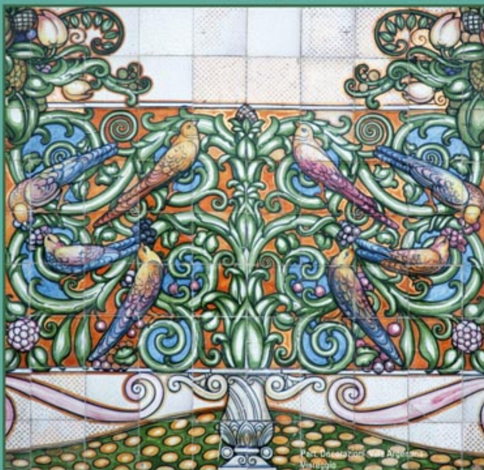
Part. Decorazioni Villa Argentina Viareggio